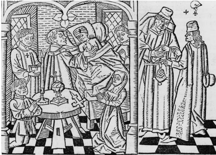
Het sacrament van de stervenden. Houtsnede uit Van den seven sa- cramenten (Gouda, Leeu, 1484).