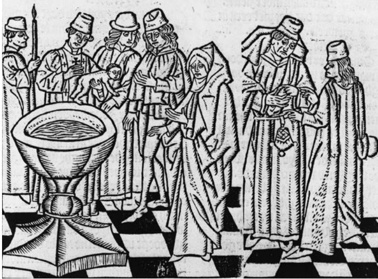
Het sacrament van de doop. Houtsede uit Van den seven sacramenten (Gouda, Leeu, 1484).

MIDDELEEUWEN – BEVOLKING (CA. 1000-1572)