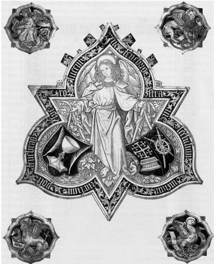
De vijf uit geelkoper vervaardigde platen die de grafzerk van Gijsbrecht Willemsz Raet sierden. Thans aanwezig in het Rijksmuseum te Amsterdam.